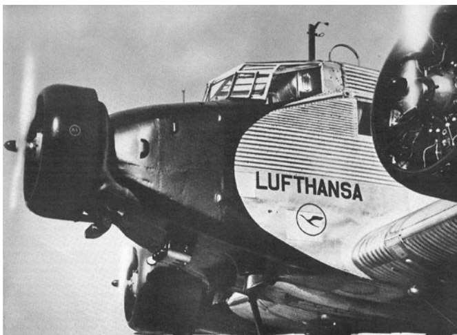
Ansicht der Peilrahmenantenne auf einer Ju 52.

Später in der Luftfahrt nutzten die Flugzeuge zur Navigation den Funk oder Radiokompass. Dazu gehörten das Anzeigeinstrument in der Instrumententafel der Pilotenkanzel, die Peilrahmenantenne (loop antenna) und die Langdrahtantenne (sense antenna) außen auf dem Flugzeugrumpf. Bei allen frühen Fotos der Ju 52 fällt die Peilrahmenantenne, die im vorderen Bereich des Rumpfes kurz hinter der Kanzel oben auf der Zelle zu sehen war, auf.