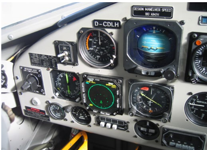
Captains Panel jetzt schon historisch.

Diese Winterliegezeit ist etwas besonderes, denn neben den routinemäßigen Arbeiten und Reparaturen wird die Avionik und damit das Cockpit vollständig erneuert, um den neuen Anforderungen gerecht zu werden. In einer der nächsten News werden wir darüber ausführlich berichten. (P. Struck)