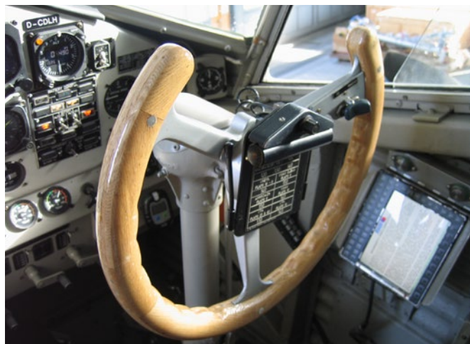
Die Steuersäule bleibt jedoch.